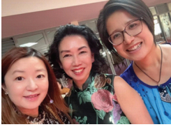
RYDE社區澳大利亞日活動